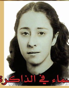
أسماء في الذاكرة