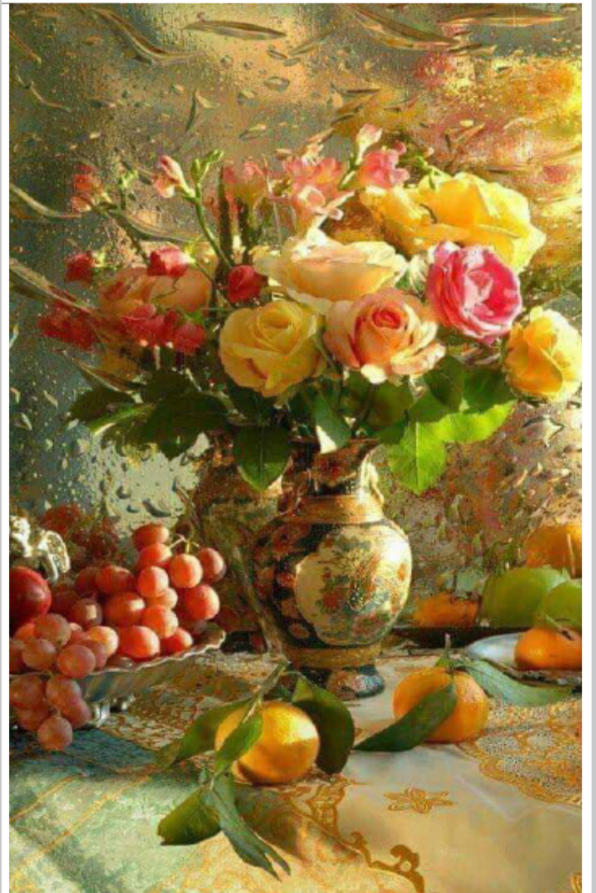
لوحة للفنانة التشكيلية العالمي ويليام ميريت تشيس