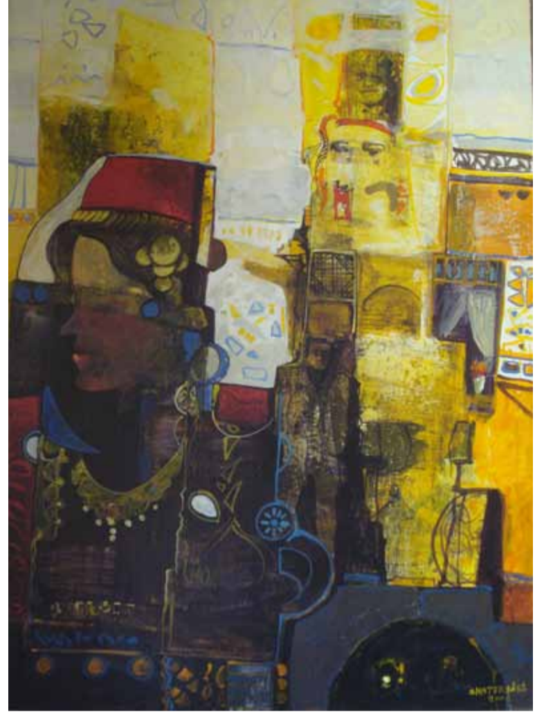
لوحة للفنان التشكيلي عصام الشاطر

إن ما يمارسه الكيان الصهيوني من وحشية فاقت الخيال - بحق أبناء الشعب الفلسطيني، وخاصة النساء والأطفال، ما هو إلا تطبيق عملي للمناهج التربوية والتعليمية التلمودية القائمة على أن أبناء فلسطين من الأشرار المدنسين، الذين يستحيل الدخول معهم في علاقة أو الإبقاء عليهم على قيد الحياة، لأنهم لا يرتقون إلى درجة الإنسانية، وهو ما يؤكد البروفيسور «أدير كوهين»، في كتابه (وجوه غريبة في المرأة) الصادر عام 1985م، وفيه تأكيد وجود أكثر من 1500 كتاب موجه إلى الطفولة والناشئة معاً، تدعو إلى ترسيخ هذا النهج الدموي الاستتصالي في التعامل مع النساء والأطفال في فلسطين، وصولاً إلى إبادة المستقبل الفلسطيني المتجذر في قلوب أبناء فلسطين وفي عقولهم وعيونهم.