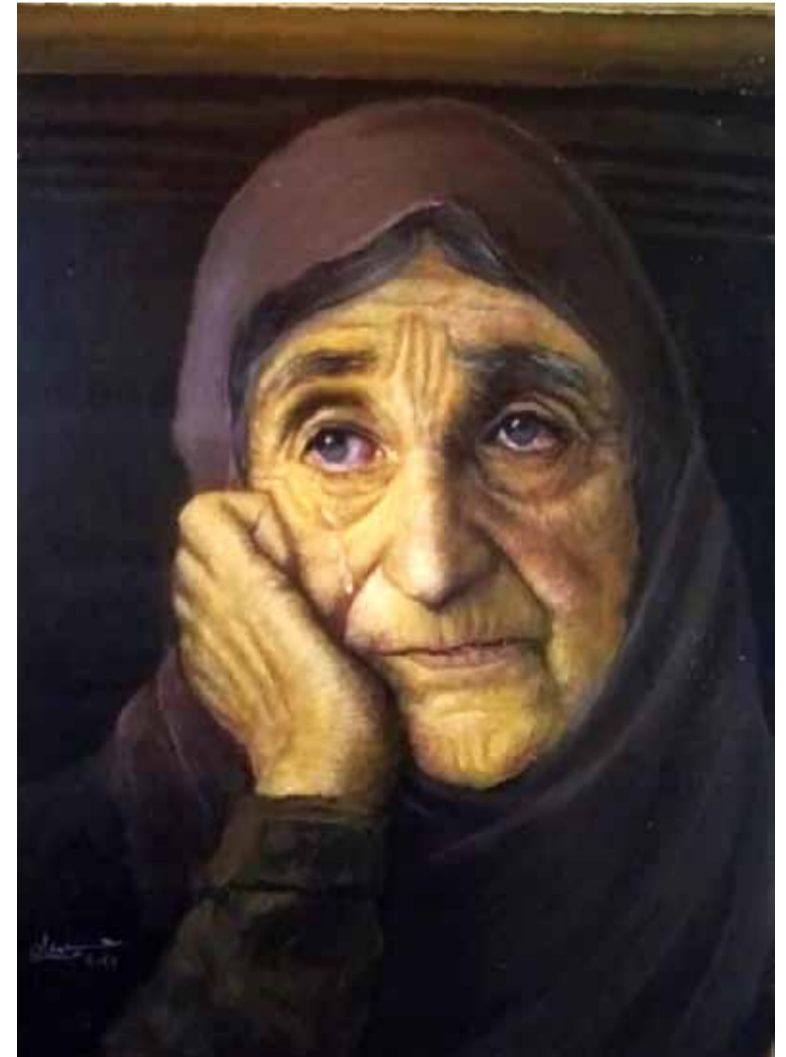
لوحة للفنان التشكيلي حسن حمدان العساف